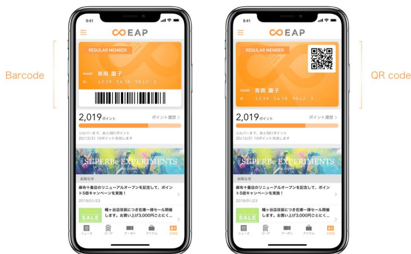
図2：会員証の基本デザインが QR コードにも対応可能になりました

これまでバーコード表示に加え、QR コード表示も選択できるようになりました。既存の板カードで QR コードをお使いの場合、システムを変更することなくアプリに会員証機能を搭載することができるようになります。